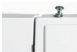
Otwieranie drzwi za pomocą przycisku

Wanna z drzwiami, wykonana jest z najwyższej jakości materiałów. Ma łatwe w użyciu drzwi, otwierane do wewnątrz i prosty zamek zatrzaskowy dla łatwej obsługi. Zintegrowane, wyprofilowane siedzisko ze składanymi podłokietnikami dla zapewnienia komfortu i wsparcia. Uruchamianie siedziska za pomocą pilota. Wanna posiada mechanizm blokowania się drzwi, funkcje bezpieczeństwa obejmują automatyczne podtrzymywanie bateryjne w przypadku awarii zasilania sieciowego. Antypoślizgowa powierzchnia dna ogranicza ryzyko poślizgnięcia. Drzwi można zamontować po lewej lub prawej stronie. Wszystkie wanny przed dostawą są sprawdzane pod względem szczelności oraz jakości wykonania. Dodatkowa opcja hydromasażu.