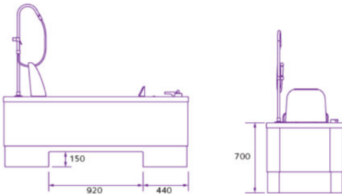
Widok z boku Wanna maksymalnie opuszczona